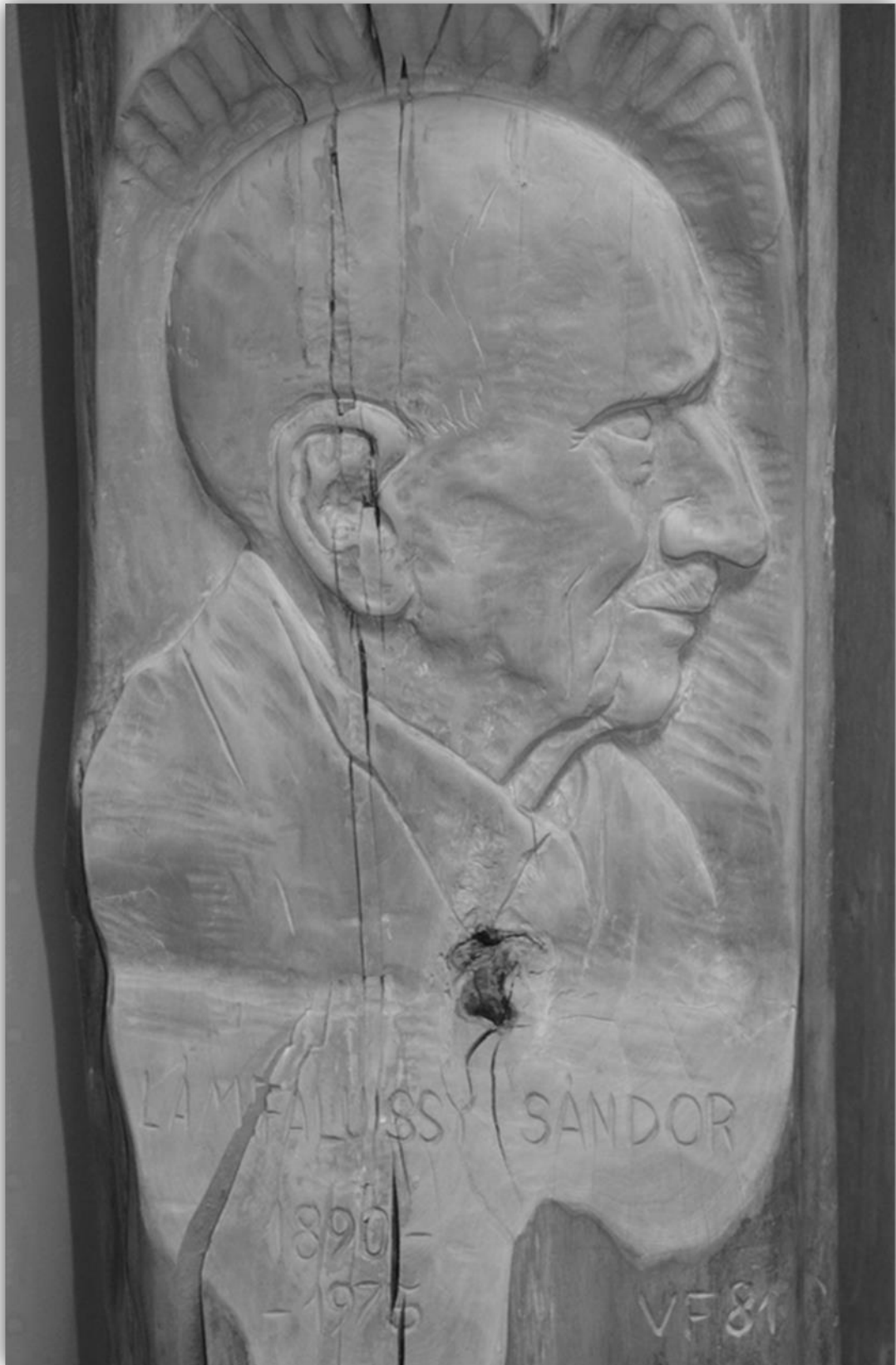
A Nyugat-magyarországi Egyetem Központi Könyvtára Órzi Lámfalussy Sándor Varga Ferenc lenti fafaragó által rönkbe vésett portréját